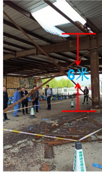
瓶场大棚顶棚高度 6 米

5 月 5 日下午 13 时左右，青啤（连云港）公司未审批完高处作业许可证，喜祥机电赵某岗就带领赵某虎、聂某某开始更换安装水槽。赵某岗负责现场作业指挥，安排聂某某在地面焊接水槽，安排赵某虎拆除顶棚上方锈蚀水槽。赵某虎使用蓝色升降机升到顶棚下面，站在升降机护栏内，仰面对锈蚀水槽进行拆除，拆除时发现水槽槽沟淤泥、铁锈多，一直掉落。赵某虎说槽沟淤泥、铁锈一直掉落没法清理，拿铁锹到顶棚上方进行清理后再拆除。赵某虎从蓝色升降机平台下来，拿起铁锹、电动扳手等工具，戴安全帽未带安全带和安全绳，乘蓝色升降平台升上去爬到顶棚上方清理和拆除水槽。赵某岗看到赵某虎未带安全带和安全绳进行高处作业，未强令制止。