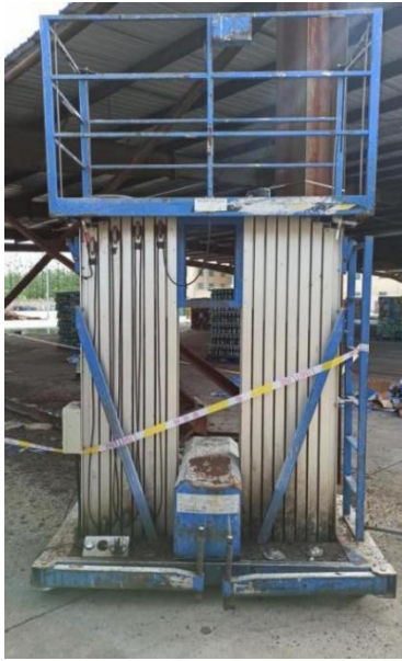
事故发生现场两台升降机