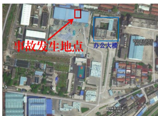
青啤（连云港）公司厂区平面图

事故发生地点位于青啤（连云港）公司瓶场大棚中部顶棚东侧导水槽。瓶场大棚始建于2006年9月，长96.6米，宽30.5米，顶棚高6米，大跨度钢架结构，顶棚铺设彩钢瓦，水泥地面。主要用于堆放空啤酒瓶、废纸箱、托盘等。事故发生时作业区域未堆放物品。